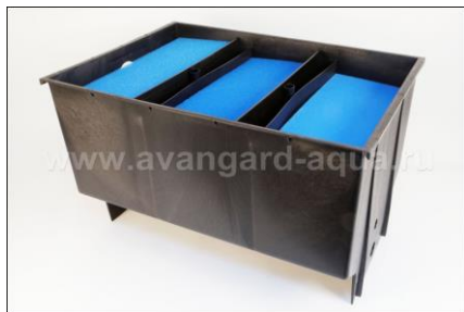
Вид без крышки