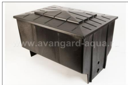
Общий вид фильтра

3-х камерный фильтр VGE 3 Chamber filter (330L) обеспечивает биологическую и механическую фильтрацию. Вода проходит через 3 камеры фильтра, которые заполнены специальными сотами для биологической фильтрации и фильтровальными губками для последовательной фильтрации от крупных к более мелким частицам.